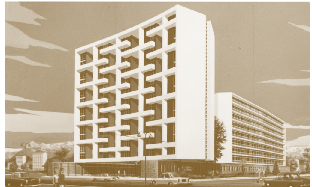
Drawing by / Zeichnung von Oliva & Baronetto, 1969 (Private collection / Privatsammlung Massimo Cotti, architetto).

DE “[Die Wohnung] wurde mit Möbeln eingerichtet, die vom Architekten gestaltet wurden, der auch das Haus entworfen hat. Da es hier keine rechten Winkel gibt – das Haus ist völlig schief – und da es völlig schief ist, mussten Möbel hergestellt werden, die in die Ecken passten. Wir haben diesen Schrank gemacht, als eine Art Kopfteil für das Bett” von Cristina Renzoni geführtes Interview mit Gianluigi B., Bewohner, 2011.