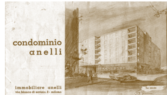
Advertisement / Anzeige, ca. 1950 (private collection).