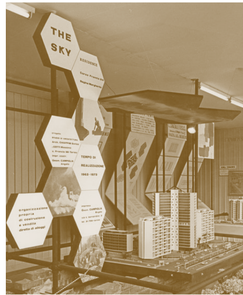
Display model of a preliminary version of the project / Ausstellungsmodell einer vorläufigen Projektvariante, Oliva & Baronetto, 1963 (Private collection / Privatsammlung Massimo Cotti, architetto).

E Housing complex / Wohnungsbau Moncalieri (Torino), 1968–74. Condominiums and rental housing, with shops / Eigentums- und Mietwohnungen mit Geschäften Architect / Architekt: Enzo Dolci (masterplan) Various developers / Verschiedene Bauträger