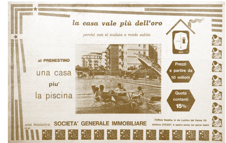
Newspaper advertisement / Zeitungsanzeige, Il Messaggero , January 4, 1969.